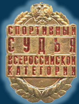
Спортивный судья всероссийской категории (ВК)