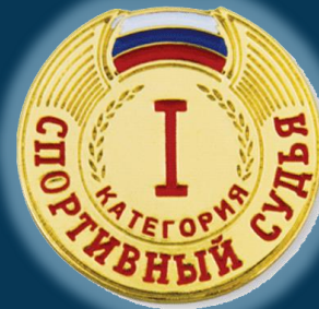
Спортивный судья первой категории (1К)