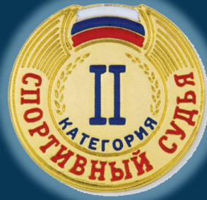
Спортивный судья второй категории (2К)