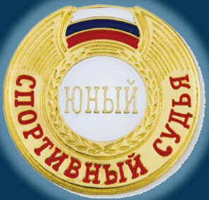
Юный спортивный судья (ЮС)