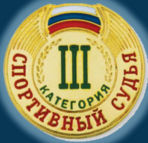
Спортивный судья третьей категории (ЗК)